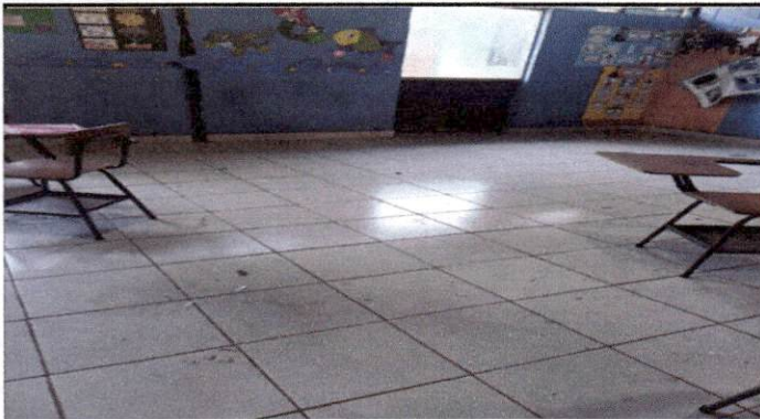
Foto 1: FINALIZACIÓN SUSTITUCIÓN DE PISO DE GRANITO POR PISO CERÁMICO MÓDULO 1.