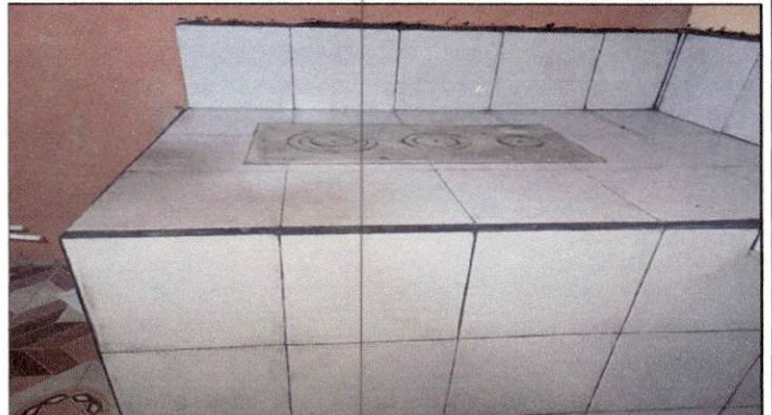
Foto 2: FINALIZACIÓN DE SUSTITUCIÓN DE ESTUFA RURAL COMPLETA MÓDULO 2.